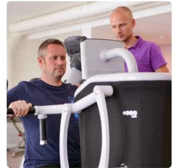
Physio SPArtoS – un équilibre holistique.